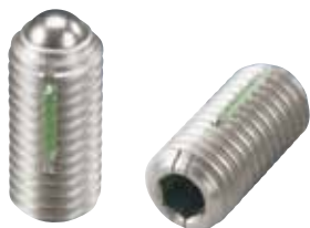
LBSUH-A (重载荷用 识别:2根线)