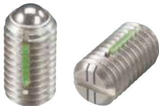
LBSUH (重载荷用 识别: 2根线)