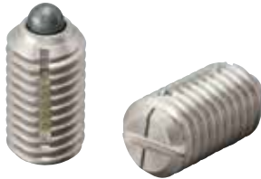
LSPLL-SUS (轻载荷用) 识别: 1根线