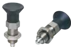
NDXN-W-SUS (不锈钢制、双螺母、销子有淬火)