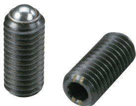
BSTH-A (重荷重用 識別:2本ライン)