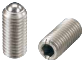
BSUH-A (重荷重用 識別:2本ライン)