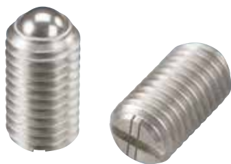
BSUH (重荷重用 識別:2本ライン)