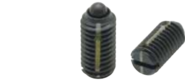
LSPLL (軽荷重用 識別:1本ライン)