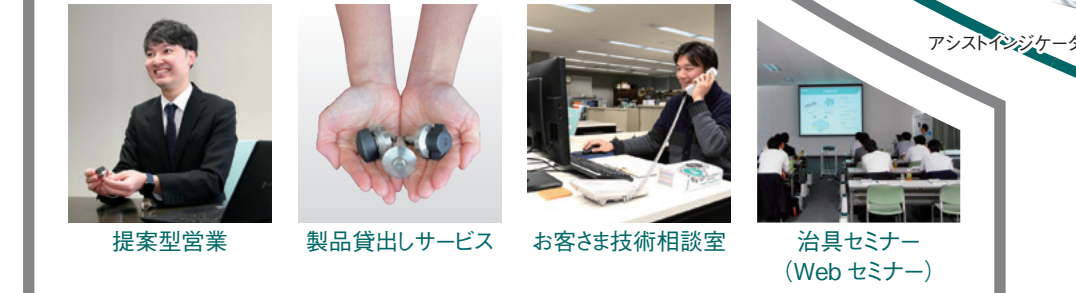
提案型営業 製品貸出しサービス お客様技術相談室 治具セミナー (Webセミナー)

当社は、すべての製品、サービスにおいて、常に「お客様満足度の向上」に取り組んでいます。お客様との双方向のコミュニケーションを大切にし、お客様にご満足いただける製品、サービス、そして問題解決のためのより良いご提案をお届けします。